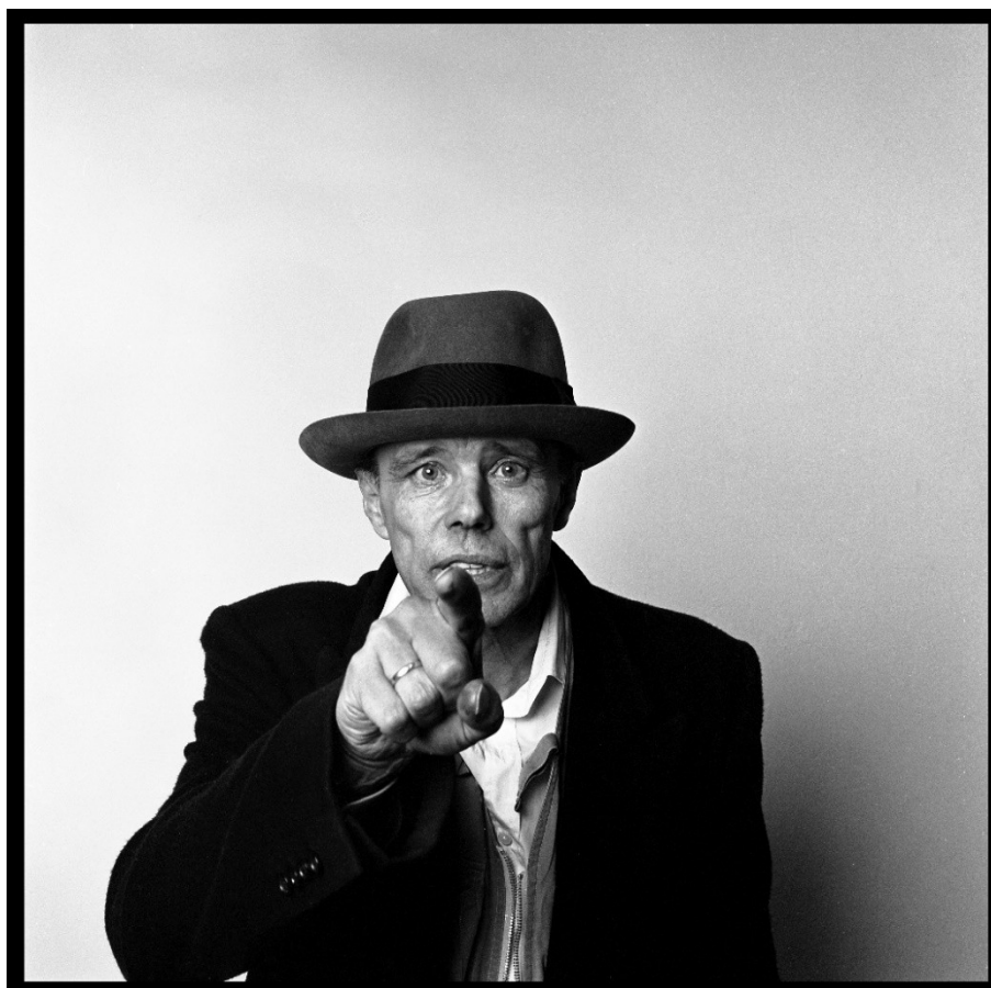
Laurence Sudre, Portrait Joseph Beuys, Paris, 1985 © Leemage / Laurance Sudre