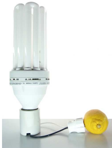
Abb.: Susi Gelb, Capri-Batterie Asian Standard (Update for Joseph Beuys), 2010

Die Ausstellung zeigt den künstlerischen Ansatz von Beuys und gibt einen Einblick in die Beuys-Sammlung der Brüder van der Grinten. Um Besucher:innen die Möglichkeit zu geben, die Werke von Beuys immer wieder neu und aus unterschiedlichen Blickwinkeln zu betrachten, werden einigen von ihnen zeitweise Arbeiten von anderen Künstler:innen gegenübergestellt, die diese Werke aufgenommen haben, um sie kritisch zu hinterfragen oder ironisch und sinnerweiternd zu kommentieren.