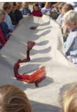
Gruppenarbeit bei einem Workshop

Vorschulkinder oder Schüler entdecken das Museum Schloss Moyland in lebendigen Führungen und Workshops. Unsere Angebote orientieren sich an den aktuellen Ausstellungsschwerpunkten und den Lehrplänen der verschiedenen Schulformen. Ziel unserer Führungen für Kinder und Jugendliche ist es, Neugier zu wecken und Zugänge zur Kunst zu eröffnen. Wichtige Aspekte des Gesehenen werden in Kleingruppen erarbeitet und präsentiert. Unsere Workshops laden zum Ausprobieren künstlerischer Techniken ein.