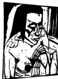
Erich Heckel, Hockende, 1913 Foto: Stiftung Museum Schloss Moyland/ Lokomotiv.de © Nachlass Erich Heckel

Kuratorenführungen am 22.1. und 18.3.2012 um 15 Uhr