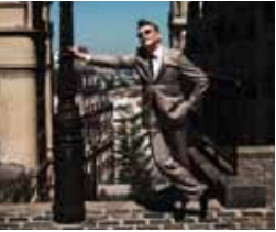
Götz Alsmann

Götz Alsmann und seine Musiker ergänzen den Reigen ihrer Lieblings-Chansons um Stücke aus dem deutschen Liederfundus, die unserer ewigen Sehnsucht nach der Stadt an der Seine, nach ihrem Charme, ihrem Esprit und ihrem Sentiment Ausdruck verleihen.