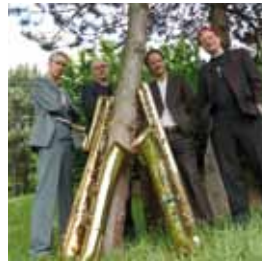
Deep Schrott

Do., 10.5.2012 20.00 Uhr Deep sind sie zweifellos, die Bass-Saxofone, aber sicherlich kein Schrott – insofern trifft es der Bandname nur halb. Sehr sanfte melodische Bögen im King-Crimson-Medley, eine von Ska und Polka angetriebene Version von Led Zeppelins „Stairway to Heaven“ und klangfarbenreiche Arrangements von Fleetwood Mac bis zu den Beatles: Deep Schrott ist weit mehr als eine kuriose Spielerei. In den Händen dieser vier Köpfer wird eine ganz eigene Tonsprache geformt, die auf das Beste Humor und Intellekt verbindet. Dieser Klang geht nicht mehr aus dem Kopf!