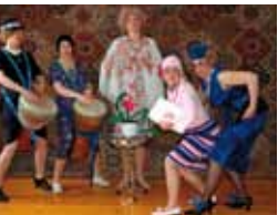
Trude träumt von Afrika Foto: Trude träumt von Afrika

Eintritt: Vorverkauf 26,40 € (inkl. VVK-Gebühr), Abendkasse 32,40 € Karten unter Telefon +49 (0)2824 9510-60, www.moylandshop.de oder kartenvorverkauf@moyland.de