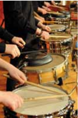
Klangwerk Münster

1998, im Jahr nach der Eröffnung des Museums, füllten bereits einmal Schlagzeugklänge das Schloss und Teile des Parks. Nun, nach der Umgestaltung und Wiedereröffnung, bringen wir erneut ganze Wagenladungen von Schlaginstrumenten an den Niederrhein. Marimbas, Vibraphone, Gongs, Trommeln, Becken und viele kleine Perkussionsinstrumente flüstern, dröhnen und singen in den Gängen und Sälen des Museums.