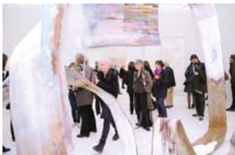
Ausstellung „Alles Gute!“