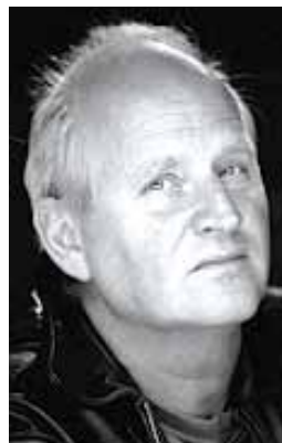
Herman Koch

Fr., 27.4.2012 In seinem neuen Roman legt Herman Koch 20.00 Uhr mit Witz und genialer Beobachtungsgabe gesellschaftliche und familiäre Risse bloß.