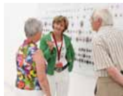
Führung in der Ausstellungshalle

Telefon +49 (0)2824 9510-68, hoeveler@moyland.de