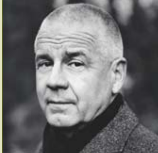
wort laut: Matthias Politycki

wort laut: Matthias Politycki liest aus „Jenseitsnovelle“ Eine mitreißende Liebesgeschichte – und ihr schlimmster Albtraum zugleich: Matthias Politycki erzählt in „Jenseitsnovelle“ vom Glück und Unglück der Liebe und wie der Tod all ihre Gewissheiten zunichtemachen kann. Eintritt: 11 €, ermäßigt 8 €