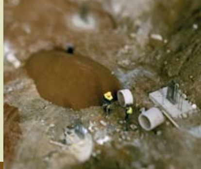
Miklos Gaál, construction men, 2004

Die Ausstellung richtet den Fokus auf 16 internationale zeitgenössische FotokünstlerInnen, die in ihren jeweils spezifischen Blicken auf Landschaft den Horizont als Trennlinie zwischen Himmel und Erde ausblenden und überwinden. Seltene Landschaften werden gezeigt, die so vertraut scheinen und dennoch höchst ungewöhnlich und verstörend zugleich sind.