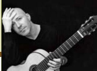
selten gehört: Frank Bungarten

selten gehört: mit Frank Bungarten (Gitarre solo) Der mit dem „Echo Klassik“ als „Instrumentalist des Jahres 2005“ ausgezeichnete Frank Bungarten spielt Werke von Bach bis Henze. Klassische Gitarrenmusik auf allerhöchstem Niveau! Eintritt: 11 €, ermäßigt 8 €